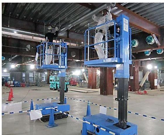
消火設備の配管材を天井内部に吊り込んでいる様子です。