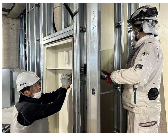
屋内消火栓設備の函を壁の下地材に取り付けている様子です。