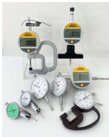
（主力製品ダイヤルゲージ等）