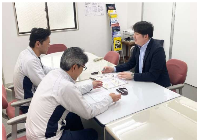
（エンドユーザーとの打ち合わせ雰囲気）