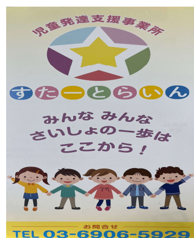
事業所パンフレット