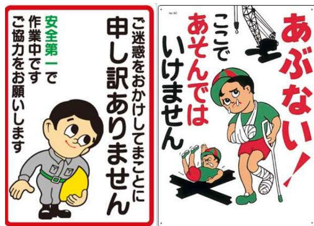
このような看板みたことはありませんか？