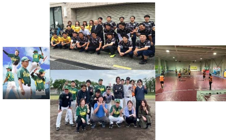
社内サークルの様子