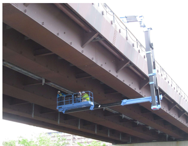
現地点検風景（大型橋梁点検車）