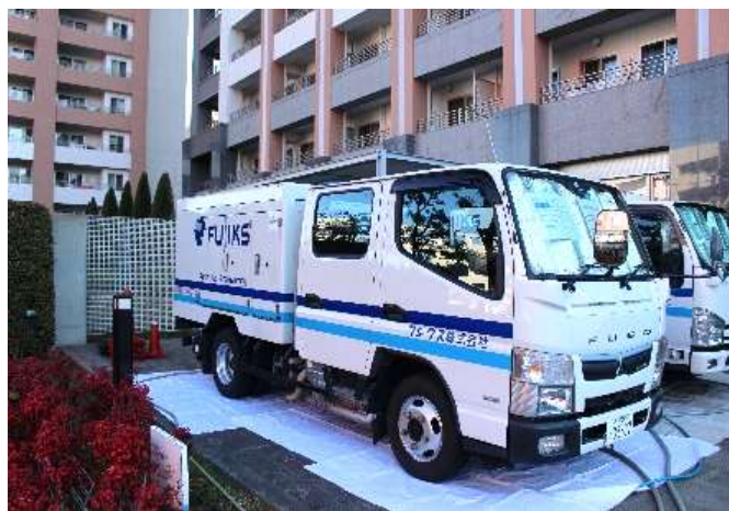
当社自慢の高圧洗浄車です！