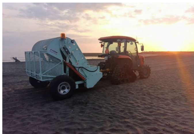
全国のビーチで大活躍中のビーチクリーナー。 運転手絶賛募集中です！