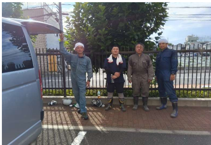
工場内清掃で大奮闘も… 残念ながらオジサンたちに余力は残っていません。。。