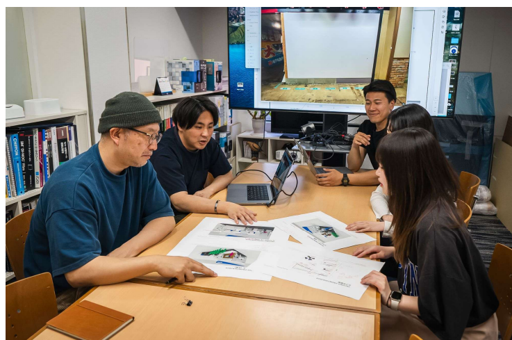
Team Meeting（デザイン部と営業担当者）