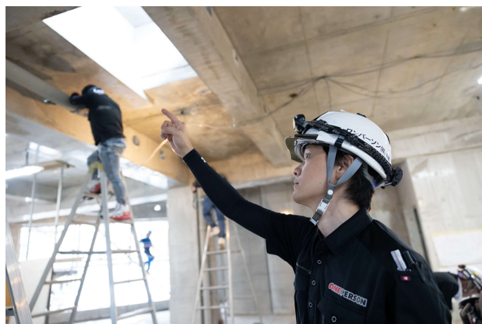
(大型・中型・小規模リフォームまで手広く)