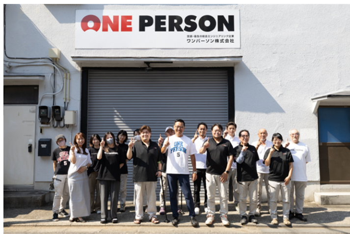
(会社を盛り上げる、仲間)