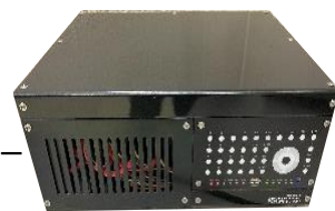
デジタルレコーダー