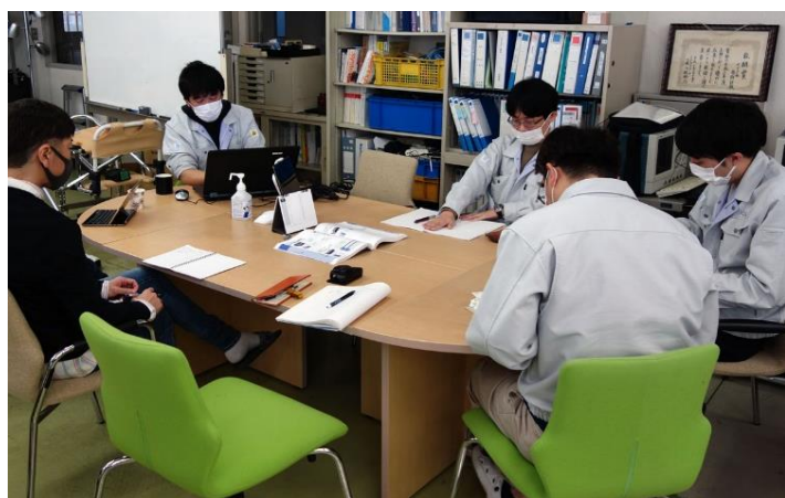
システム開発会議の様子