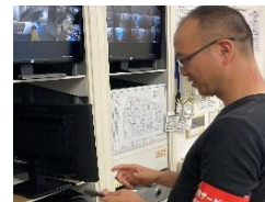
現場での最終確認作業

営業経験 5 年目 最初は難しいかもしれませんが、上司や先輩に聞きながら仕事を覚えて、今は、お客様のニーズを聞いて満足いただけるシステムの提案が出来るようになり仕事にやりがいを感じています。 また、先輩もフランクに接してもらえるので気軽に相談が出来ます。