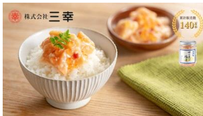
主力商品「サーモン塩辛」