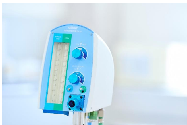
オンリーワン商品の笑気吸入鎮静器