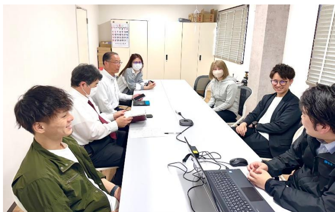
ミーティングの様子