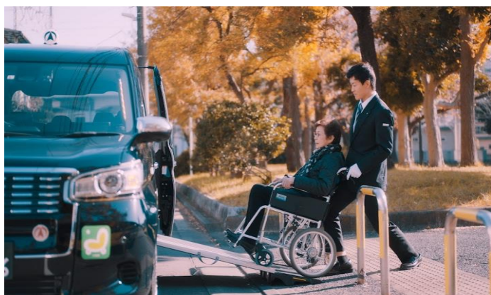
タクシー乗務員職は素敵なお仕事です