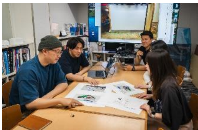
Team Meeting(デザイン部と営業担当者)