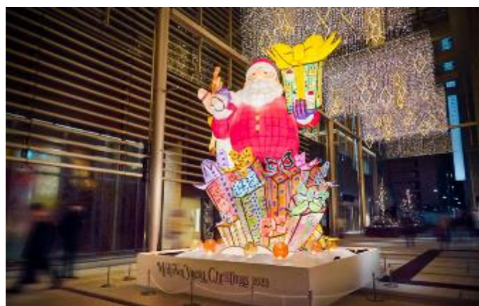
ミッドタウン八重洲 クリスマスマーケット施工後写真