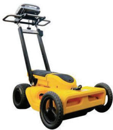
地中埋設物探査機