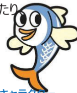
三幸キャラクター ままかりくん

私は中途入社で前職も食品営業関わる仕事をしておりました。東京営業所は少数でコミュニケーションも取れ働きやすい会社だと感じております。会社側も繁忙期以外は有給取得も後押ししてくれますし、バースデー休暇も取れます。勤怠もスマートフォンを導入したりオフィスも綺麗になったりとどんどん変化していています。創業78年と安定している点が私の入社決め手になりました。