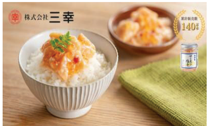
主力商品「サーモン塩辛」