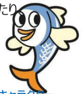
三幸キャラクター ままかりくん

私は中途入社で前職も食品営業関わる仕事をしておりました。東京営業所は少数でコミュニケーションも取れ働きやすい会社だと感じております。会社側も繁忙期以外は有給取得も後押ししてくれますし、バースデー休暇も取れます。勤怠もスマートフォンを導入したりオフィスも綺麗になったりとどんどん変化していています。創業78年と安定している点が私の入社決め手になりました。