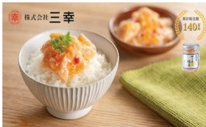
主力商品「サーモン塩辛」