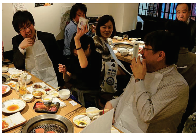
社員感謝デー（月に一度の食事会）