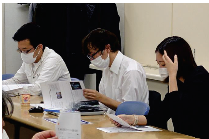
キャリアアップ研修（社内）