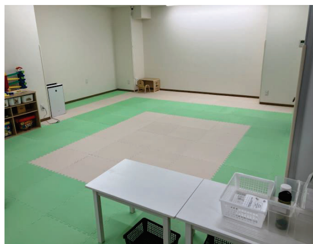
事業所の内観(児童が集団活動を行う訓練室)