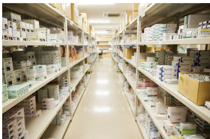
当社の医薬品倉庫。メーカーラインナップが強みです！