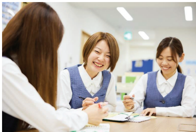
定期的なミーティングでアイデアを出し合っています