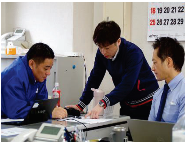
営業マン 相談中の様子