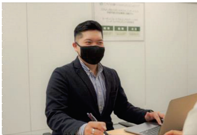
顧客との打ち合わせの様子