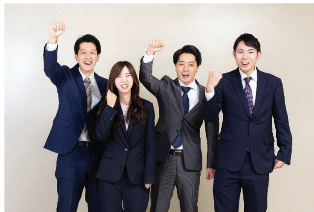
それぞれの「ハート」を届けよう