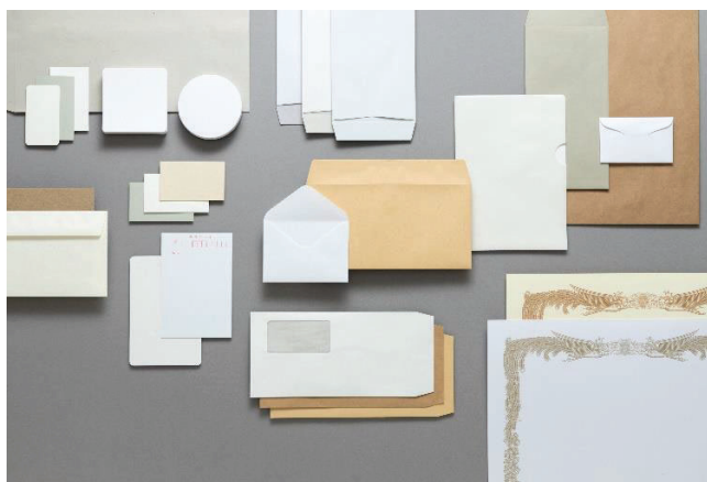
高品質の自社製造紙製品