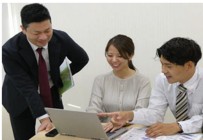
社内ミーティング風景