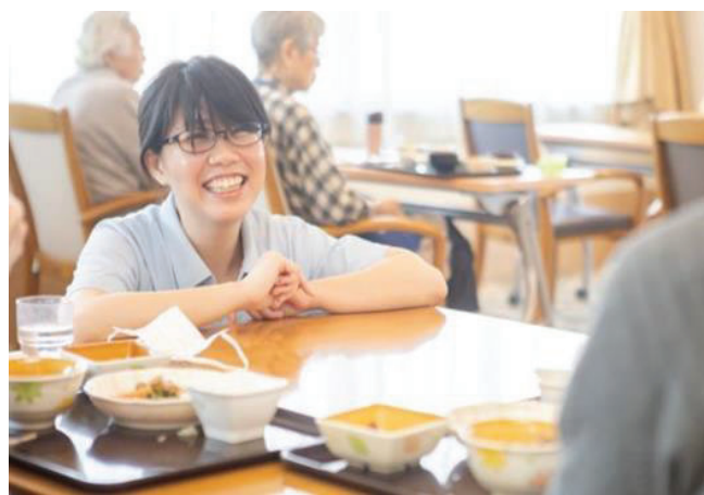
施設内での介護風景