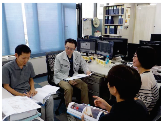
ミーティングの様子