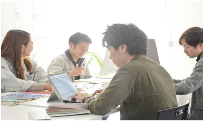
社内での打ち合わせ風景