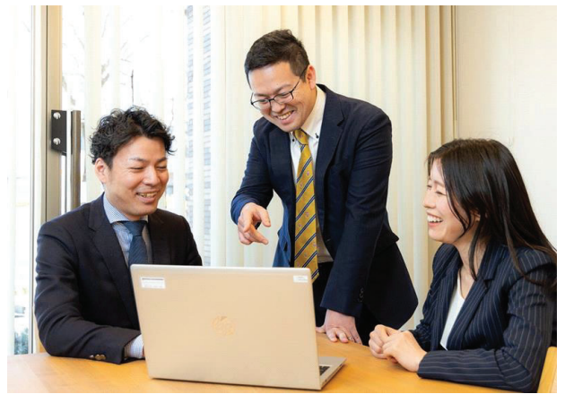
ベテランから若手スタッフまで風通しのよい職場です