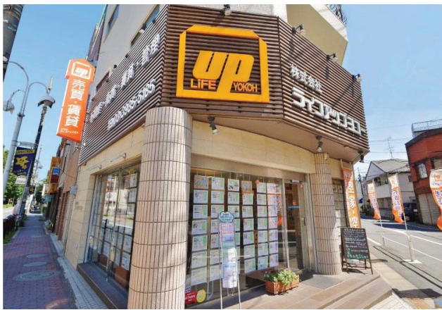
上板橋本店は板橋区立教育科学館の目の前です