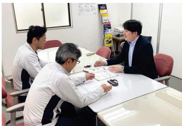
エンドユーザーとの打ち合わせ雰囲気