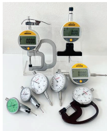
主力製品ダイヤルゲージ等