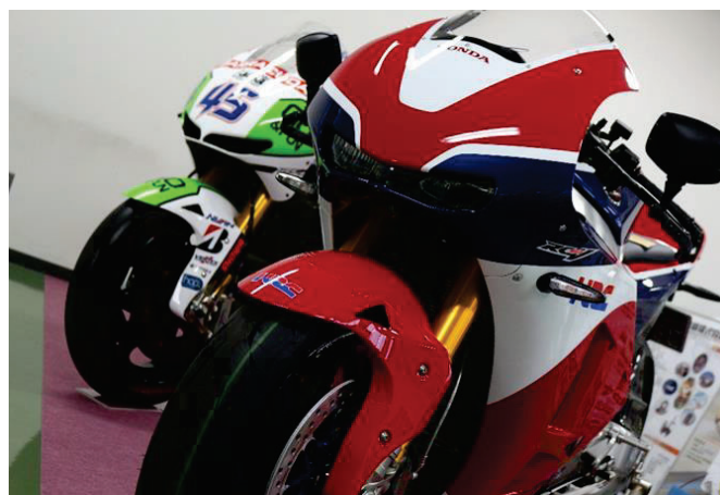
レース用 2 輪車エンジンの部品提供