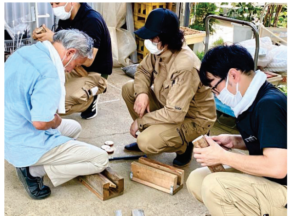
資格取得試験に向けての研修風景