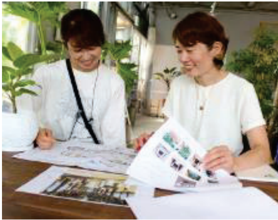
社内ミーティングの様子