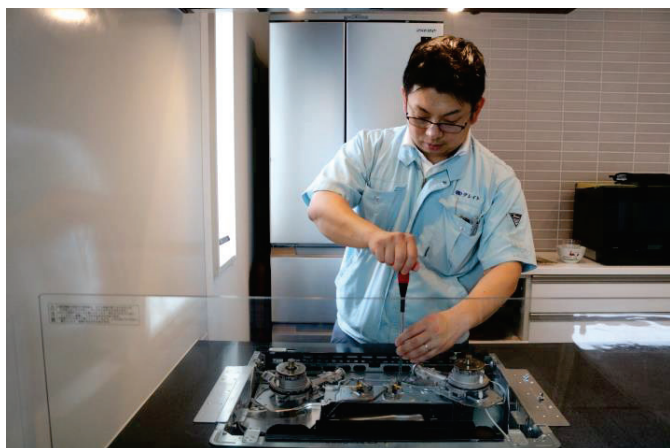
ビルトインコンロの修理風景です