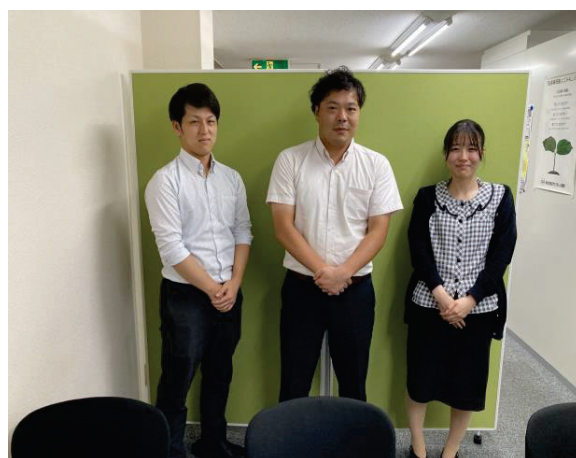
営業部のメンバー