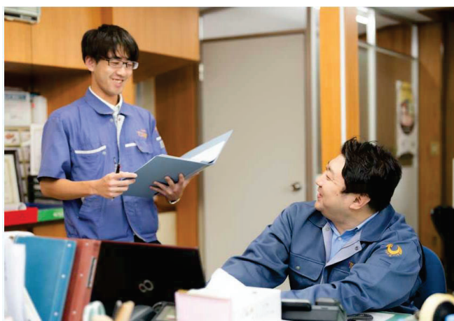
弊社2階の事務所の業務風景です。