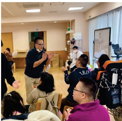
音楽活動の様子です。みなさん音楽が大好きでリリです。