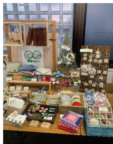
活動の中で作成した商品です。施設内やイベントで販売しています。