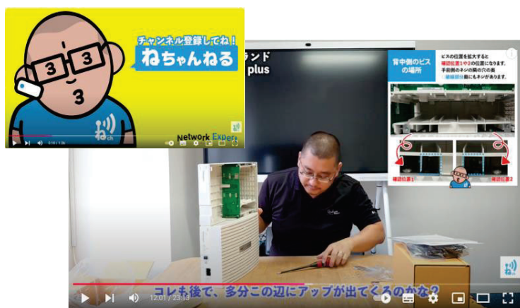
ネットワークエキスパート公式YouTubeチャンネル「ねちゃんねる」