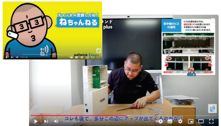
ネットワークエキスパート公式YouTubeチャンネル「ねちゃんねる」