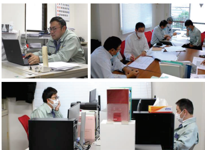
営業所の様子です