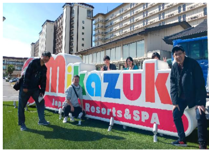
イベントを通して親睦を深めています