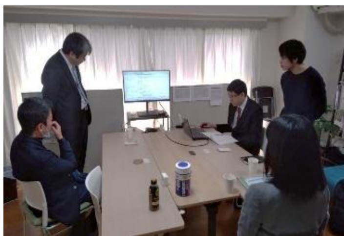
ミーティングの様子