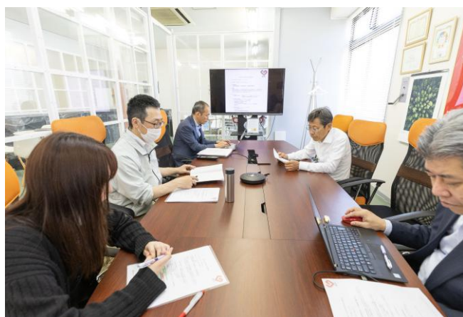
技術・開発ミーティングを密に行っています