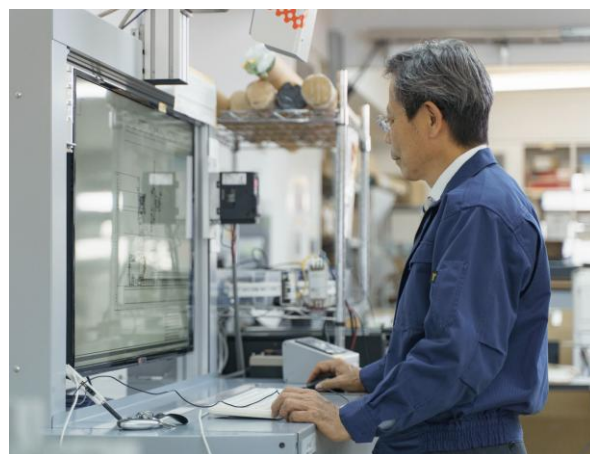
検証・開発環境も自分たちでセットアップします