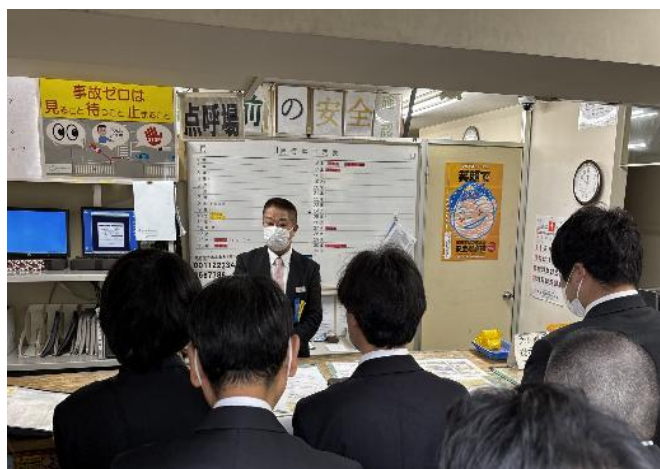
出庫前に点呼を受ける様子