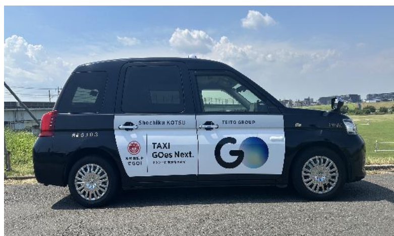
タクシー車両：ジャパンタクシー