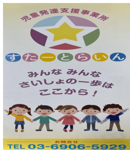
事業所パンフレット