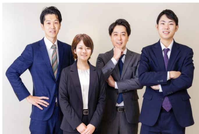
それぞれの「ハート」を届けよう