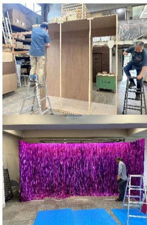
会場設営時や製作物の事前仮設置の様子