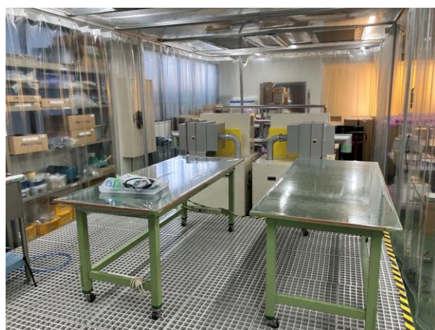
製品の組立や評価を行うクリーンブースです