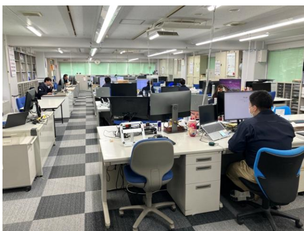
図面の作成業務などを行っている事務所です