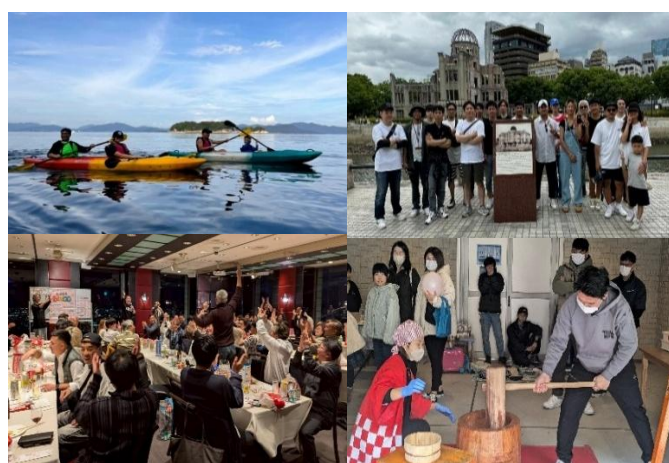
(社内イベントの様子)